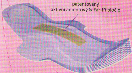
patentovaný aktivní aniontový & Far-IR biočip